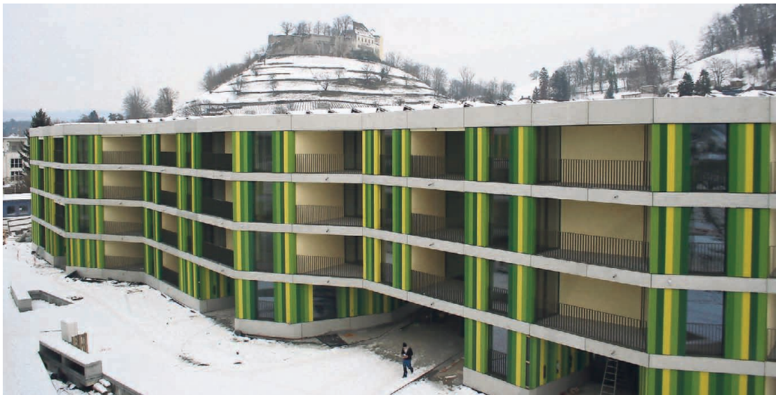
Optimale Lage: Einerseits sucht der Ausblick auf das Schloss weitherum seinesgleichen, andererseits liegt die attraktive Altstadt nur wenige Schritte entfernt.

Geheizt wird die Minergie-Überbauung mit umweltfreundlicher Fernwärme. Ein erster Holzschnittel-Heizkessel der SWL Energie AG leistet 350 Kilowatt und versorgt die Wohnungen in den zwei fertigen Baufeldern. In einer zweiten Etappe will die SWL Energie AG einen zweiten Heizkessel mit 700 Kilowatt Leistung in Betrieb nehmen und die vier verbleibenden