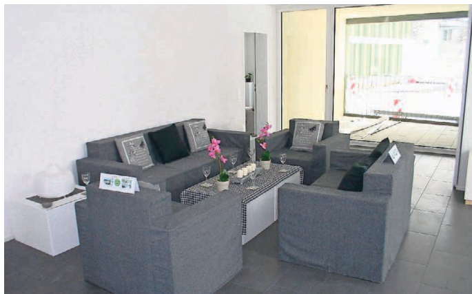
Die Grundrisse der Wohnungen überzeugen durch ihre durchdachte Raumaufteilung.