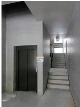
Die Tiefgarage ist direkt mit den Treppen- und Liftanlagen verbunden.