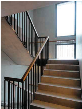
Das grosszügige Treppenhaus ist komplett in Sichtbeton gehalten.