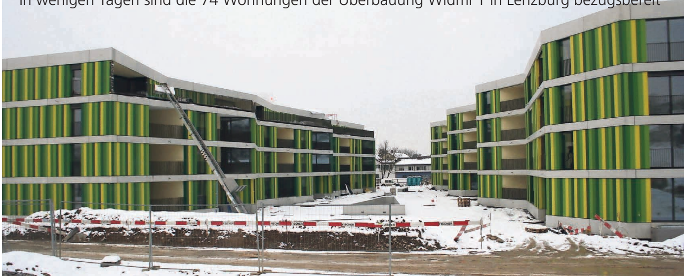
Die Fassaden der beiden drei- und viergeschossigen Baukörper eröffnen gegen innen eine reichhaltige Fülle an Gestaltungsraum und Begegnungszonen.

In wenigen Tagen sind die 74 Wohnungen der Überbauung Widmi 1 in Lenzburg bezugsbereit