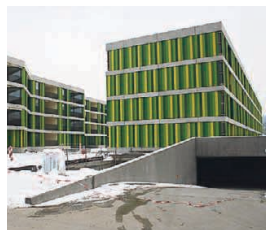
Praktisch: Die Einfahrt zur Tiefgarage erfolgt am Kopf der Siedlung.

den Baufelder mit Fernwärme versorgen. Übrigens stammt sämtliches Holz aus Wäldern in Lenzburg und Umgebung. 300 Kubikmeter Holzschnittel fasst das Lager. In einem durchschnittlichen Winter können damit alle sechs Baufelder drei Wochen mit Wärme versorgt werden. «Nicht vergessen dürfen wir in diesem Zusammenhang die Photovoltaikanlage, die sich auf dem extensiv begrünten Flachdach befindet», sagt André Meier. «Wir gehen davon aus, dass die Anlage gegen 90 000 Kilowattstunden Strom pro Jahr leistet und damit beträchtlich zur guten Energiebilanz der Überbauung beiträgt.»