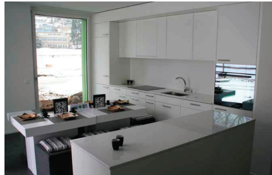
Zeitgemäss: Die komplett in Weiss gehaltenen Küchen sehen nicht nur gut aus, sondern sind auch äusserst pflegeleicht.