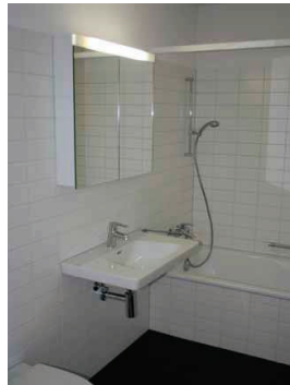
Auch der Innenausbau entspricht höchsten Qualitätsansprüchen.