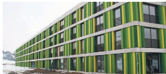
Gegen aussen erscheinen die Fassaden der beiden Kuben hart und schroff.